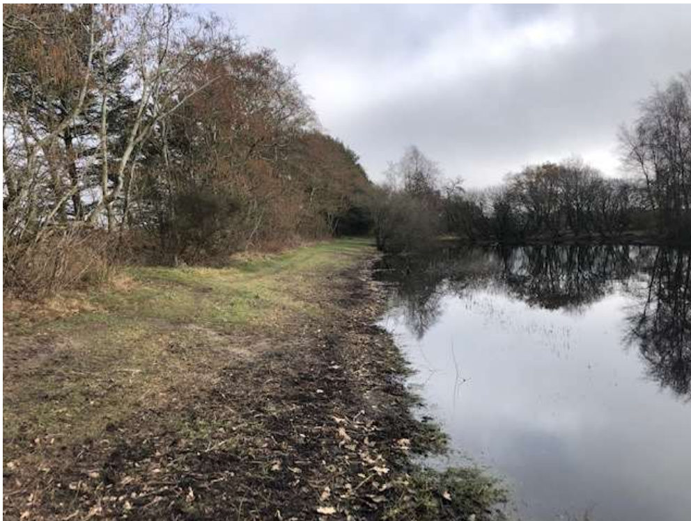
Vandhullets sydlige bred, hvor den værdifulde vegetation fandtes. Bredden er nu rensat for grenstumper, et smal urtebælte er intakt, og nye planter kan sandsynligvis spire frem fra frø og plantestumper i jorden.

Det meste af krattet og størstedelen den værdifulde urtevegetation var fjernet ved den ret gennemgribende kratrydning. Mosen er kratryddet inden Esbjerg Kommune havde meddelt dispensation til arbejdet. Vi var dog indstillet på at meddele dispensation til kratrydning, da en skånsom rydning ville kunne åbne for lysindfald til urtelaget i den ret tilgroede mose, og fjerne en del af de invasive arter i mosen. En forudgående ansøgning om at lade grenene ligge på mosefladen, jordbehandle og opsætte andehuse ville være blevet mødt med et afslag.